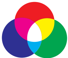
additive farbmischung primärfarben rgb